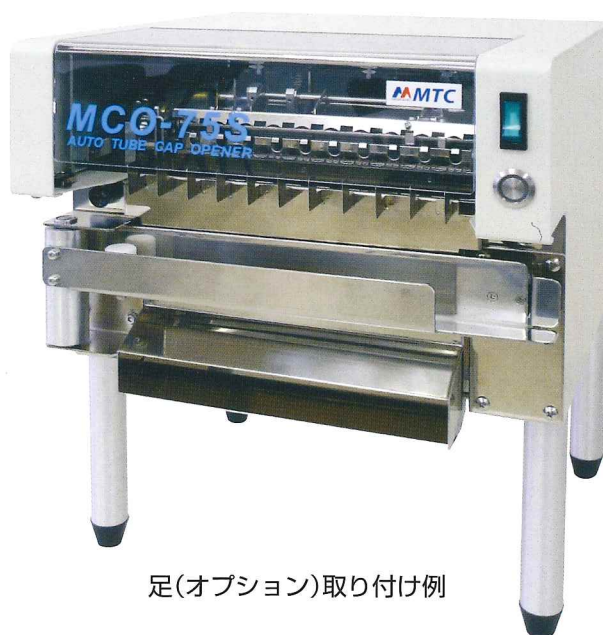
足(オプション)取り付け例